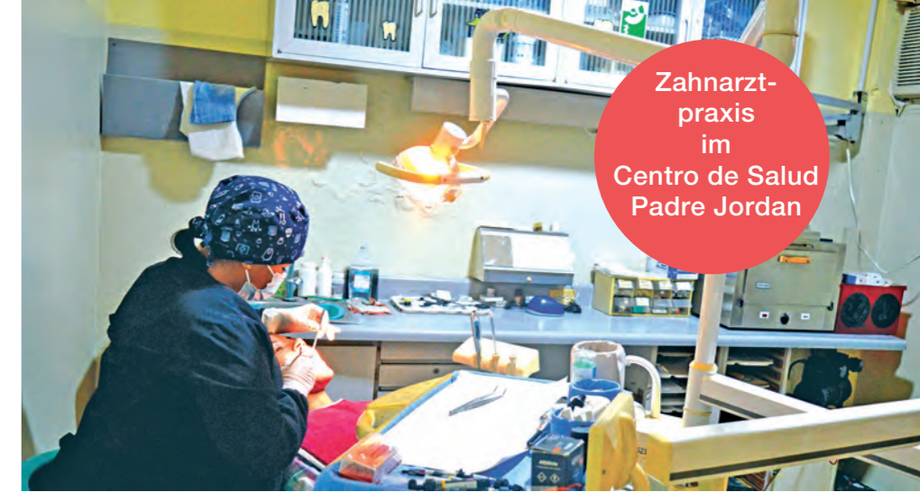
Zahnarzt- praxis im Centro de Salud Padre Jordan