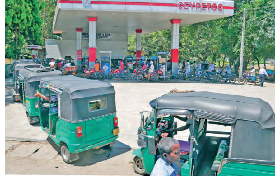
Auto-Rikschas warten während der Wirtschaftskrise in Sri Lanka an einer Tankstelle auf Kraftstoff.

„Da sind gravierende Fehlentscheidungen der Regierung. So wurde im vergangenen Jahr z.B. von einem Tag auf den anderen der Einsatz von Kunstdünger untersagt. Die Menschen waren nicht vorbereitet. In der Folge hat es Missernten gegeben und gewaltige Einbrüche bei den Einnahmen. Heute haben wir eine Schuldenkrise und eine Wirtschaftskrise. Und dann kamen Corona und der Russland-Ukraine-Krieg hinzu.“