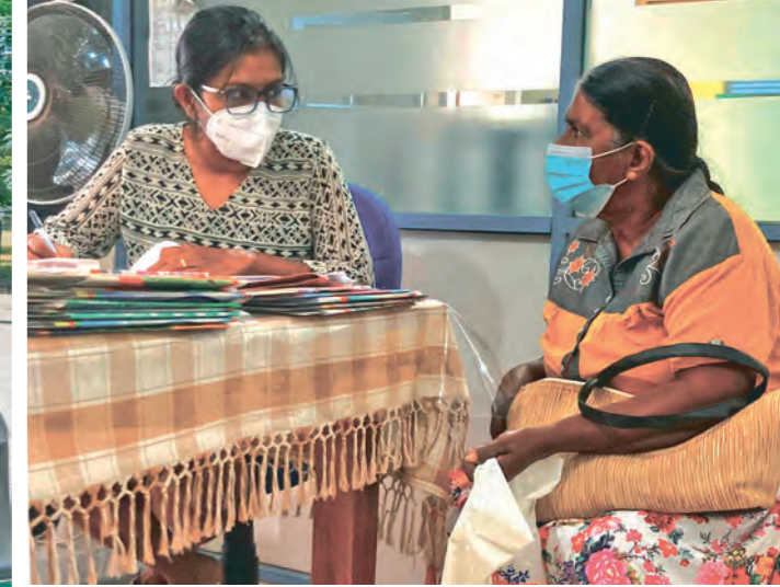
Die Sprechstunden sind voll, die unzureichende Ernährung führt zu Mangelerscheinungen und Krankheiten. Die Ärzte helfen, so gut es geht.

Vor Tankstellen stehen zig Autos, die nicht selten vergeblich auf eine Tankfüllung warten. Benzin ist kostbar dieser Tage, denn Sri Lanka bekommt Treibstoff nur gegen Devisen – harte Dollar. Weder Staat noch Bürger haben sie. Der Mangel hat sich etabliert, die Rationalisierung ist organisiert. Jedem privaten Autobesitzer stehen pro Woche 20 Liter zu. Was das heißt, erleben wir bei unseren Fahrten durch das Land, die wir sehr reduziert und genau geplant