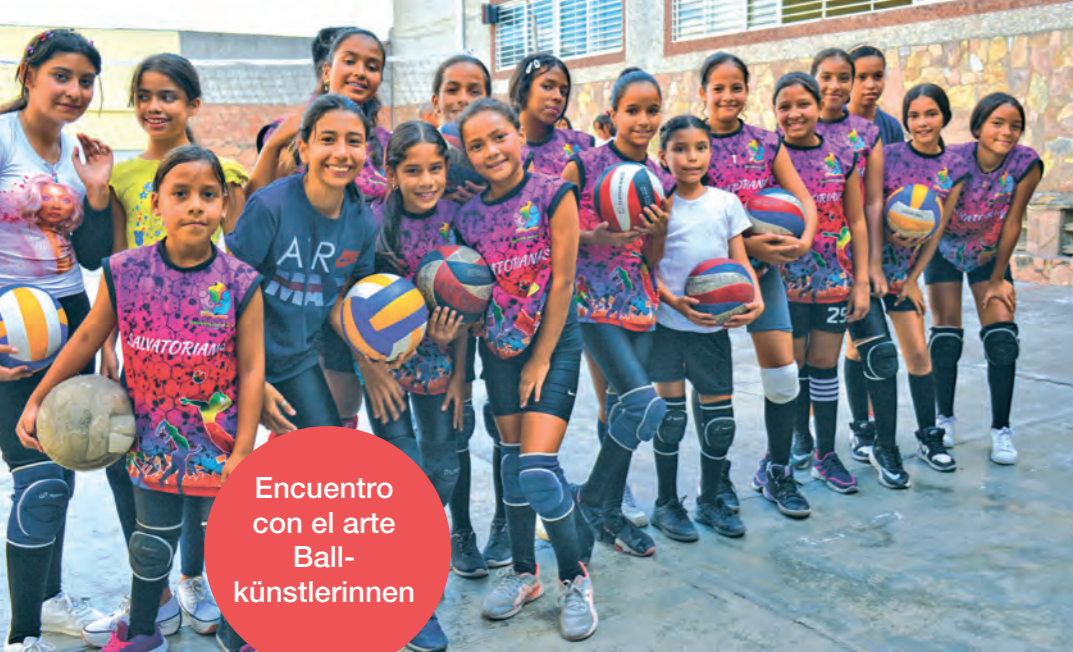
Encuentro con el arte Ball-künstlerinnen