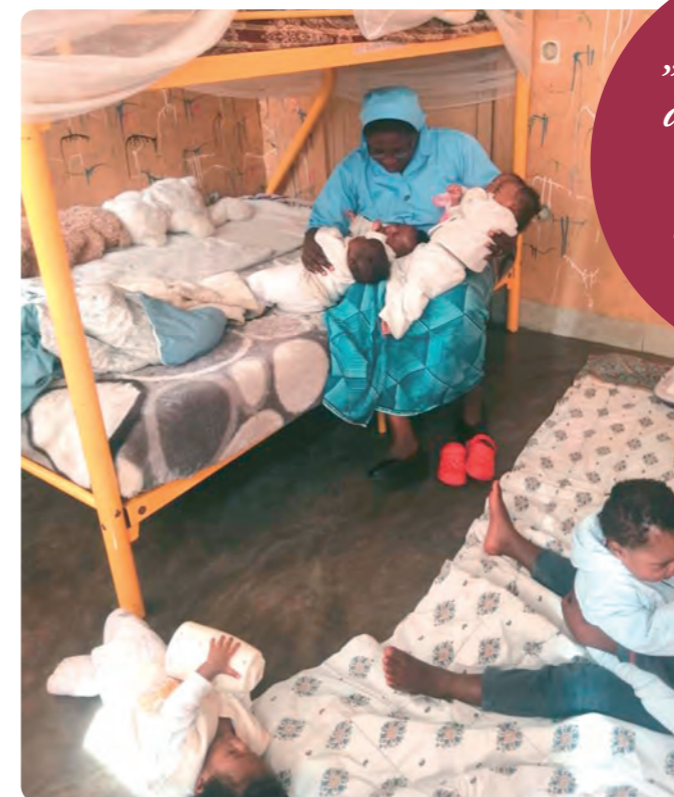
Blicke in Camp und Kinderstube. Per Handy übermittelt am 1. August 2023.

fen und Menschen zu töten. Wenn ihnen die Flucht gelingt, brauchen sie Schutz und Hilfe. Viele sind traumatisiert und haben schwere Schuldgefühle. Nur mit viel Unterstützung kann für sie ein neues Leben beginnen.“