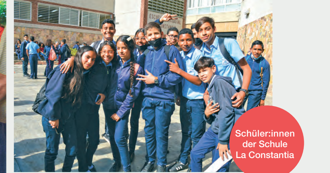
Schüler:innen der Schule La Constantia

Unser intensives Besuchsprogramm wird in den folgenden drei Tagen mit den beiden Kinder- und Jugendheimen der Salvatorianer fortgesetzt. Das erste Heim, mit dem Namen „El Encuentro“, ist ein hübsches Haus, ein Zuhause für rund 10 Kinder mit unterschiedlichen Hintergründen. Die meisten sind Opfer von Gewalt und Vernachlässigung, andere haben zwar Familienangehörige, die jedoch nicht in der Lage sind, für sie zu sorgen. Die Pralinen, die wir aus Italien mitbringen, helfen dabei, das Eis zu brechen, und nach einem schüchternen Start fassen die Kinder Mut und führen uns bei der Hand durch ihr Haus: „Schau mal! Hier spielen wir, hier machen wir unsere Hausaufgaben und hier sind die Tiere, um die wir uns kümmern.“ Es ist schwer, sich von ihnen zu trennen, ihr Durst nach Liebe und Zuneigung ist stark. Aber man sieht auch, dass sie in guten Händen sind. Es gibt mütterliche Frauen, die sich bei der Aufsicht und Anleitung unter der Koordination erfahrener Pädagogen abwechseln. Auch hier wird nichts dem Zufall überlassen, die Aktivitäten werden gründlich durchdacht und strukturiert.