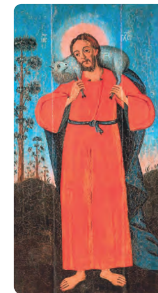
Der ‚Gute Hirt‘, Moldawien, 18. Jahrhundert