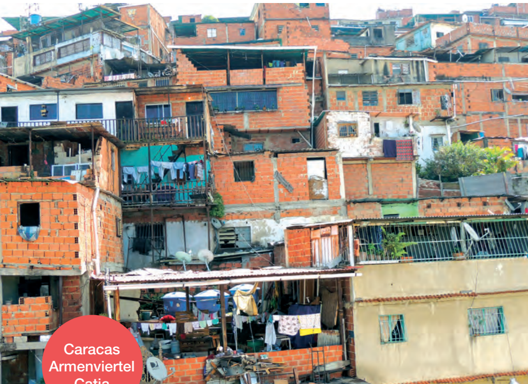
Caracas Armenviertel Catia