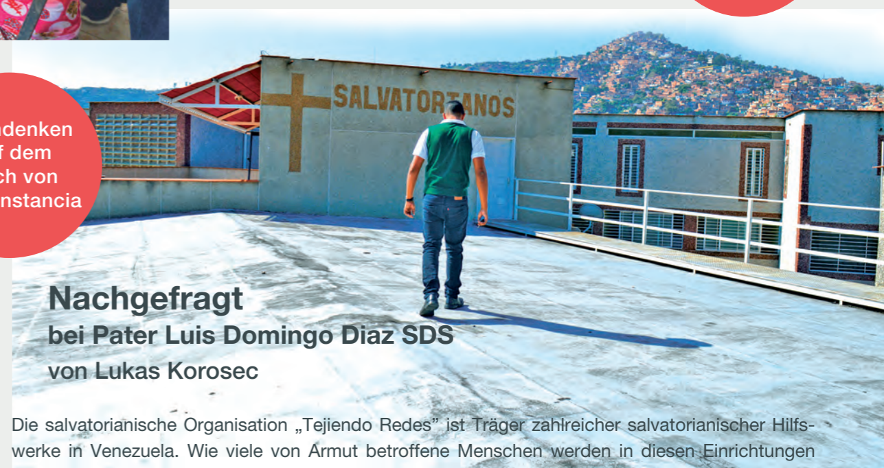
Nachdenken auf dem Dach von La Constantia

Übertragung aus dem Italienischen: Lukas Korosec