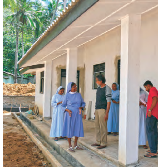
In Kurunegala treffen sich Schwestern und Bauleiter regelmäßig um den Fortgang der Arbeiten zu besprechen und zu kontrollieren. Ab Januar 2024 finden zunächst 30 Frauen und Männer Platz im neu gebauten Altenheim.

Rund 1.000 Menschen leben in Boscopura, einem sozialen Brennpunkt. Das tägliche Frühstück hilft – die Kinder gehen jetzt regelmäßig zur Schule.